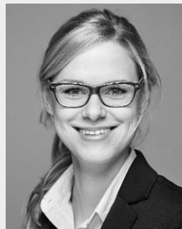
Dr. Laura Truchet Laboklin GmbH & Co. KG